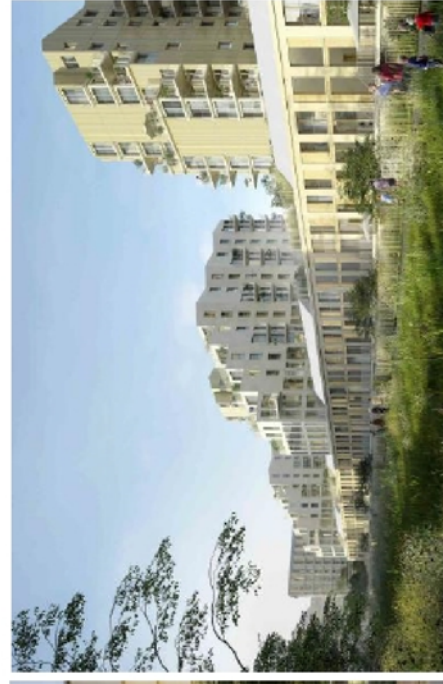
Vue depuis la noue paysagère